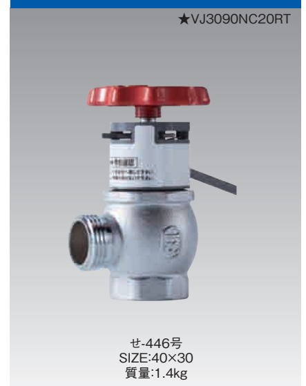
V601 30アンクル弁テスト機能付