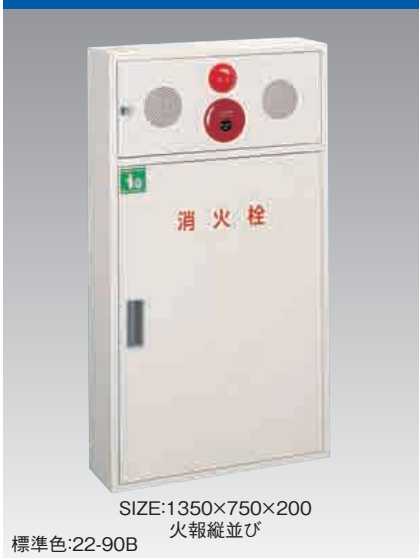
B672 PR30型二段単独型 Eタイプ