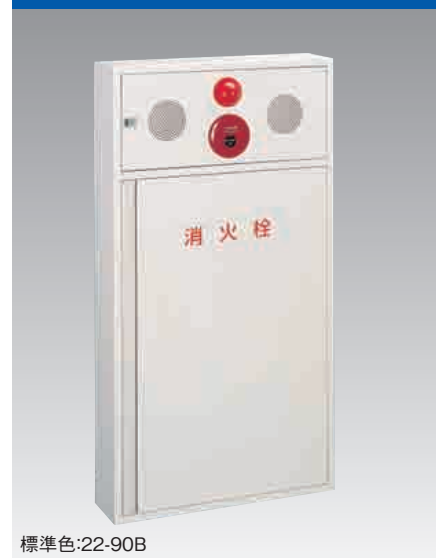
B677 公共建築設備標準型 Eタイプ