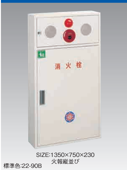
B673 PR30型二段併設型 Eタイプ