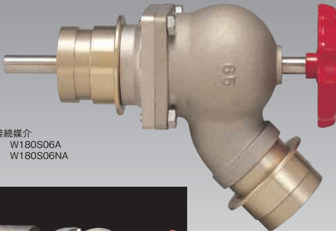
TV型接続媒介 差込式 W180S06A ねじ式 W180S06NA